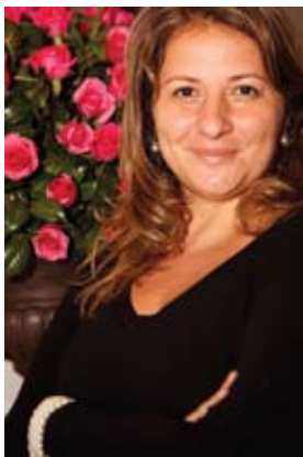
Crédito: Caê Diniz

Com o espírito de renovação, que marca o início de cada ano, gostaríamos de compartilhar com vocês os mais importantes acontecimentos de 2011, ano em que comemoramos os 50 anos da APAE DE SÃO PAULO. Nesta edição trazemos os principais eventos e ações que marcaram essa festividade, com destaque para a peça publicitária da campanha em comemoração ao nosso cinquentenário que trouxe o brilho das pessoas com deficiência para o foco, intitulada “Eu também nasci para brilhar” . Além dos eventos que traduziram um pouco do nosso trabalho e alegria de cada comemoração, destacamos também o lançamento do Programa Nacional dos Direitos da Pessoa com Deficiência – “Viver sem Limites” , pelo Governo Federal, que traz na sua essência a superação de barreiras e desafios da Sociedade para que as pessoas com deficiência possam viver com autonomia e inclusão plena. De grande importância para nossos atendidos e familiares, os eventos de 2011 trouxeram, além do sentimento de satisfação e alegria, a certeza de que são as pessoas com deficiência que nos inspiram e nos motivam a darmos continuidade ao nosso trabalho. É com esse espírito de força e entusiasmo que desejo que iniciemos este ano podendo novamente, ao final, olhar para trás e ter a sensação de mais um ano de missão cumprida e superada. Boa leitura a todos!